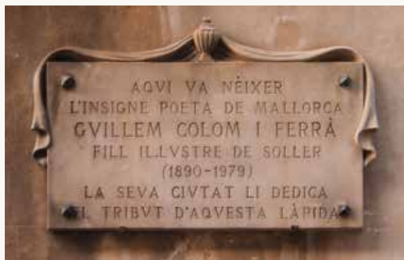
Làpida laudatòria a la casa natal de Sóller, al carrer d'Isabel II.

Cau lenta, la neu, cau com en deliri, clara com el ciri, blanca com el lliri, sobre el cementiri on jeu el fill meu.