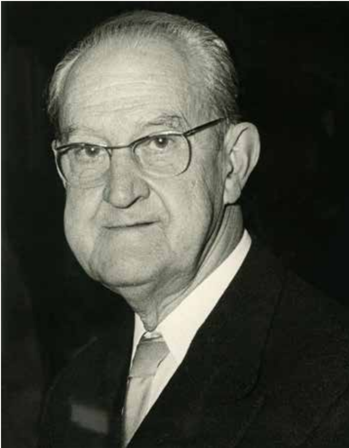
L'escriptor Guillem Colom, en una imatge de la dècada del 1970.