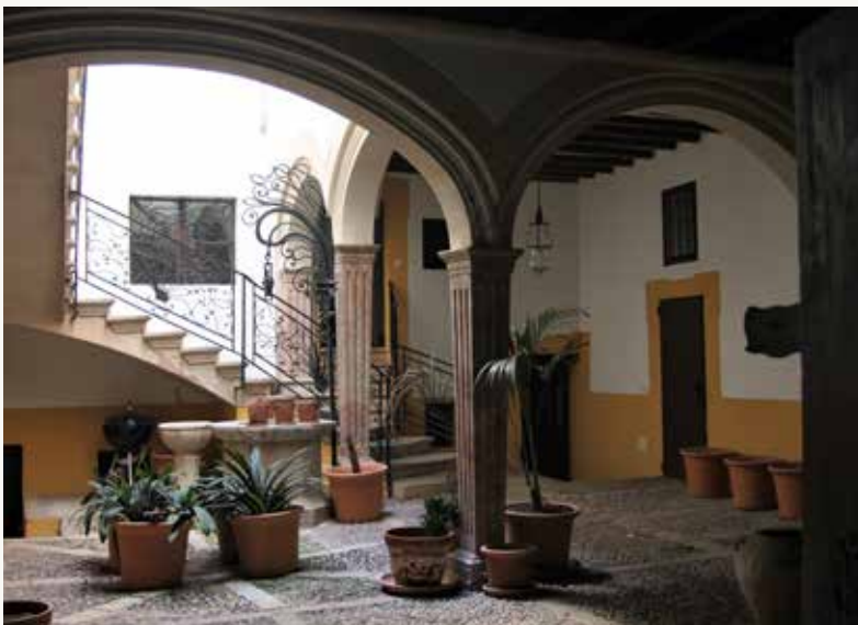
Pati de can Colom, al carrer de can Anglada de Palma.

I és precisament per aquest tarannà i per la seva coneixença, que, quan l'any 1950 es va declarar el dogma de fe de l'Assumpció de Maria, el poeta Colom va escriure ex professo la composició Tríptic de l'Assumpció , publicada llavors com un opuscle (125 exemplars). Ara es